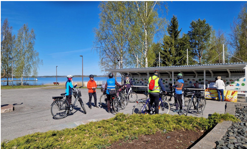
Pyöräilyn superlauantain lähtöhetki